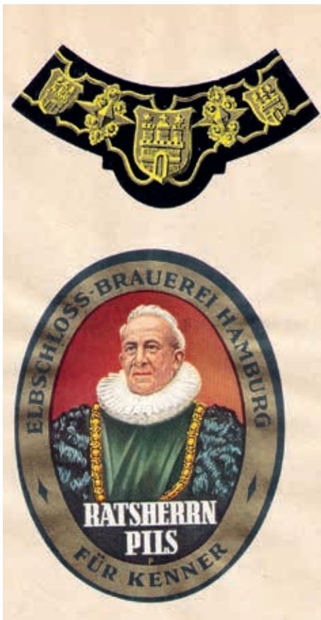
Brust- und Bauchetikett 1951

sehenswert. Die Modernisierung anderer Betriebsabteilungen wurde weiter vorangetrieben. Durch einen erweiterten Ausstoß, inzwischen 276.000 hl im Jahr 1962/1963, wurde der Ausbau der Flaschen-Abfüllabteilung nötig. Im März 1968 wurde die 0,5 l Euro-Flasche eingesetzt, da die Flasche mit Bügelverschluss in Hamburg ausgedient hatte.