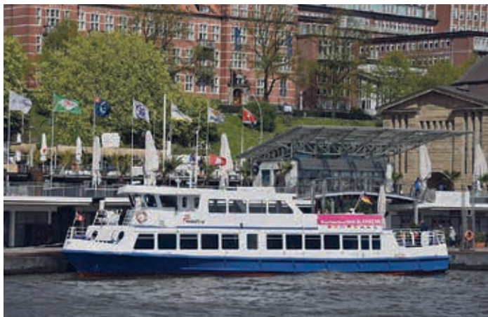
Die Fähre „Kleine Freiheit“