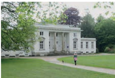
Die Villa im Hirschpark

Als Calvinist war Godeffroy im lutherischen Hamburg ein Außenseiter, doch gelang es ihm, durch seinen wirtschaftlichen Erfolg großes Ansehen zu erlangen. Er ließ sich von dem damals noch jungen und später berühmten Architekten C. F. Hansen die noch heute bestehende Villa errichten: Ein repräsentativer zweistöckiger Bau mit säulengeschmücktem