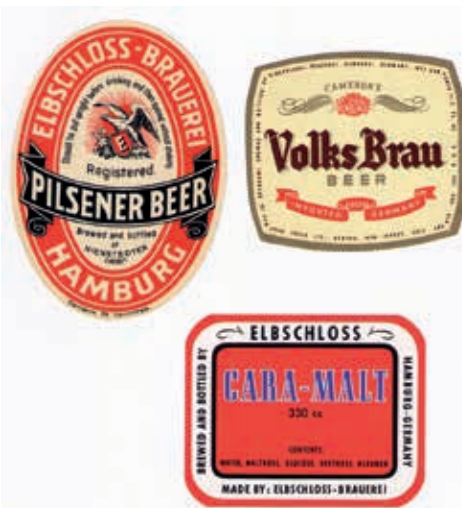
Export-Etiketten nach 1945

rei Peter Döhle als Firmensitz dient. Der Brauereiausgang, der hinter der erhaltenen Fassade die Elbschloss-Residenz beheimatet. Wahrscheinlich wird es nur noch wenige Menschen geben, die beim Vorbeigehen an den Gebäuden fragen: „Wisst Ihr noch?“